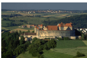
Pilti või graafikat kirjeldav pealdis.

Kui olete pildi valinud, paigutage see artikli juurde. Paigutage pildi pealdis kindlasti pildi juurde.