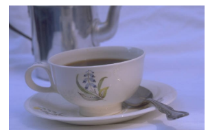
Pilti või graafikat kirjeldav pealdis.

Kui olete pildi valinud, paigutage see artikli juurde. Paigutage pildi pealdis kindlasti pildi juurde.